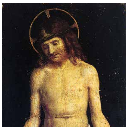
Giambattista Cima da Conegliano, Cristo Passo , olio su tavola

La pala era evidentemente destinata ad una piccola cappella privata della famiglia i cui membri sono raffigurati nel dipinto. Del dipinto occorre soprattutto sottolinearne la qualità eccezionale della resa pittorica e l'efficacia stupenda nella resa dei sentimenti. Jacopo è abilissimo nel superare i vincoli posti dalle dimensioni obbligate del dipinto, dando una particolare rilevanza al corpo ormai senza vita di Cristo, abbandonato in avanti, quasi in diagonale; e questo gli permette di inserire, a destra, le figure dei donatori e della Maddalena, prove superbe delle sue splendide doti di ritrattista.