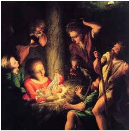
Lelio Orsi, Adorazione dei pastori , olio su tavola