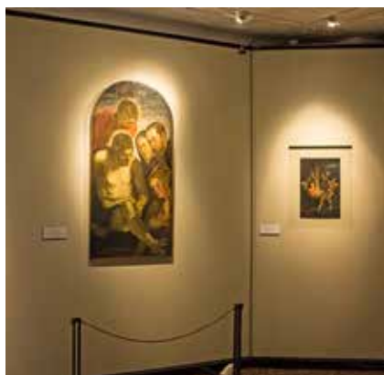
Ca' Rezzonico, la Collezione Ferruccio Mestrovich