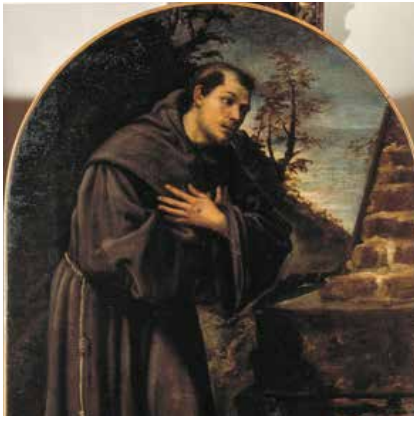
Francesco Beccaruzzi, San Francesco , olio su tela