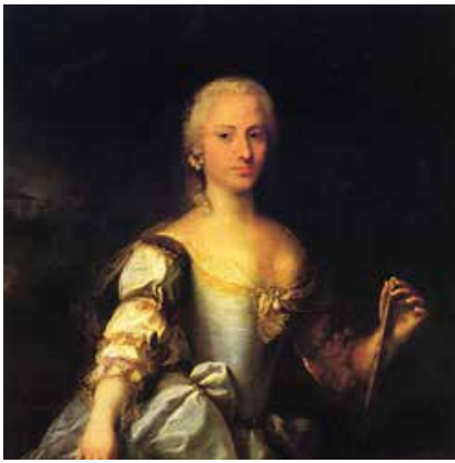
Jacopo Amigoni, Ritratto di giovane donna (la debuttante) , olio su tela